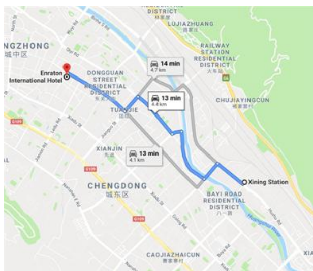
图 1 从西宁火车站至目的地的示意图

与会人员至西宁尔顿国际大酒店报到。地址：西宁市城东区东关大街 59 号。联系人：董经理。电话：1559768578。