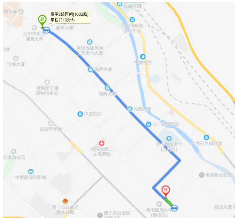
图3 青海民族大学至伊尔顿酒店示意图

如图2所示，从西宁曹家堡飞机场至会议目的地，即：西宁伊尔顿国际酒店，约为：27公里，行车时间为30分钟。